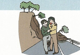
崖崩れ、土砂崩れ、岩石などの 落下によるケガ