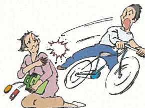
自転車で歩行者に衝突し ケガを負わせた