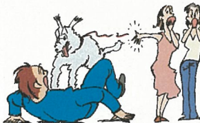
散歩中に飼い犬が他人に 噛みつきケガを負わせた