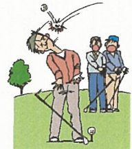
ゴルフ中、他人に ケガを負わせた