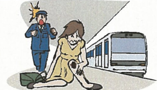
ホームで転んでケガ