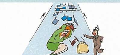
建造物の倒壊や 建造物からの物の落下によるケガ