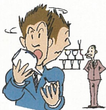
買い物中、高価な商品を 落として壊した

日本国内において、日常生活における偶然な事故により、他人にケガをさせたり、他人の財物に損害をあたえ、法律上の賠償責任を負われたとき保険金をお支払いします。