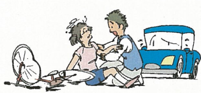
交通乗用具に乗っているときのケガ