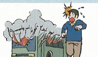
交通乗用具の火災

(※)「交通乗用具」とは、電車、自動車、原動機付自転車、自転車、飛行機、船舶等をいいます。詳細につきましては、取扱代理店または弊社までお問い合わせください。