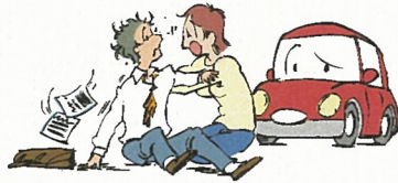
交通乗用具にはねられたときのケガ